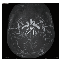
図2：脳血管の画像、末梢の細かい脳血管が明瞭に描出されている。

は、非常に有用性が高い検査領域です。頭部MRIは、急性期脳梗塞の診断に有用で、拡散強調画像を撮像すれば、梗塞病変が明瞭に見られ、3T MRIの方では、かなり画像が鮮明で、小さな梗塞巣も、明瞭に描出されます。脳梗塞は、症状の出現から診断までの時間で、治療法やその後の経過に影響を及ぼします。CTとは異なり、梗塞の発病数時間後には、信号変化が判るため、脳梗塞の早期診断には、極めて有用であり、脳梗塞の早期発見および早期治療に絶大な威力を発揮します。次に、脳血管の検査ですが、造影剤を使用することなく選択的に血管画像が描出でき、3T MRIでは、末梢の細かい脳血管、狭窄の程度、小さな動脈瘤が、より明瞭に描出されます。また従来どおり、MRI画像を用いた早期アルツハイマー型認知症診断支援システム(VSRAD)を利用し、認知症疾患の早期診断、早期治療にも役立っています。MRIは、整形外科領域にも、有用であり、一般的に、レントゲンやCTでは軟骨や靭帯の評価は困難であるため、腰椎椎間板ヘルニア、靭帯損傷、半月板損傷、腱板損傷、筋損傷など骨以外の運動器異常の評価、腰椎圧迫骨折に関しては、新鮮骨折の評価や、レントゲンやCTではつきりしない骨折傷の診断も可能です。3T MRIでは、手関節、足関節、指の小さな関節を鮮明に撮影することができ、