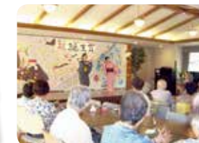
お誕生会 (多目的ホール)