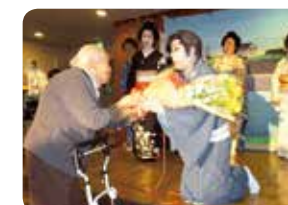
ボランティア交流