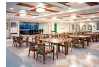
食 堂 (各階)