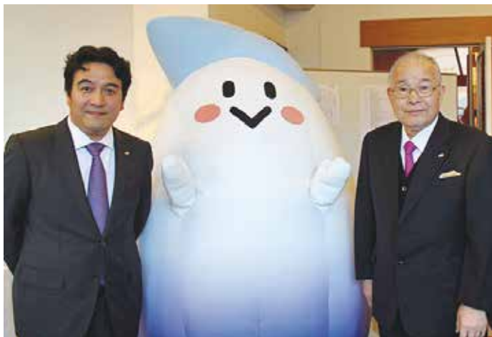
左から、高尾理事長、ぜっとくん、高尾代表