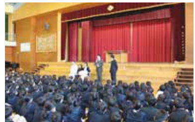
12/8児童朝礼で贈呈しました。