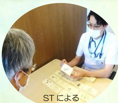
ST による 高次脳機能・口腔・嚥下機能訓練