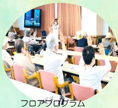
フロアプログラム