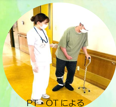
PT・OT による 個別の身体機能訓練