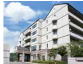
ドリームガーデン倉敷