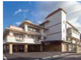
ピースガーデン倉敷

訪問看護・訪問介護・鍼灸院 予防リハ・通所リハ・ショート ケアプラン室・地域包括センター