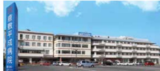
倉敷平成病院 [救急指定]

脳神経外科・神経内科・整形外科など全22科。220床を運営。 (グランドガーデン南町より西へ車で3分) 協力医療機関