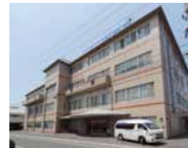
倉敷在宅総合ケアセンター

訪問看護・訪問介護・鍼灸院 予防リハ・通所リハ・ショート ケアプラン室・地域包括センター