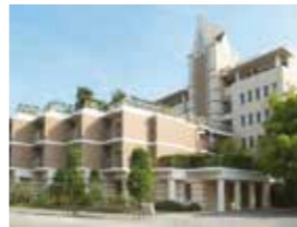
ローズガーデン倉敷