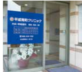
平成南町クリニック