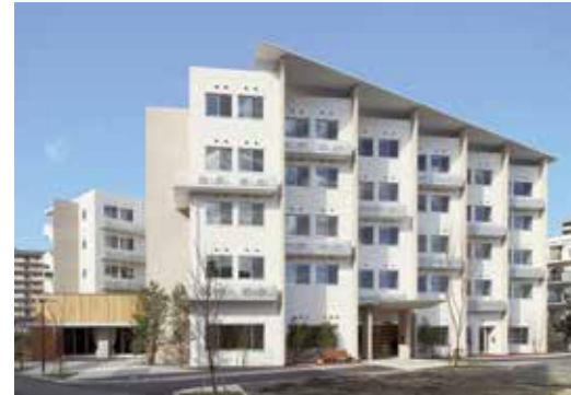
グランドガーデン南町

予防・医療・福祉の連携、ケアの連続を誇る全仁会グループから誕生した サービス付き高齢者向け住宅「グランドガーデン南町」