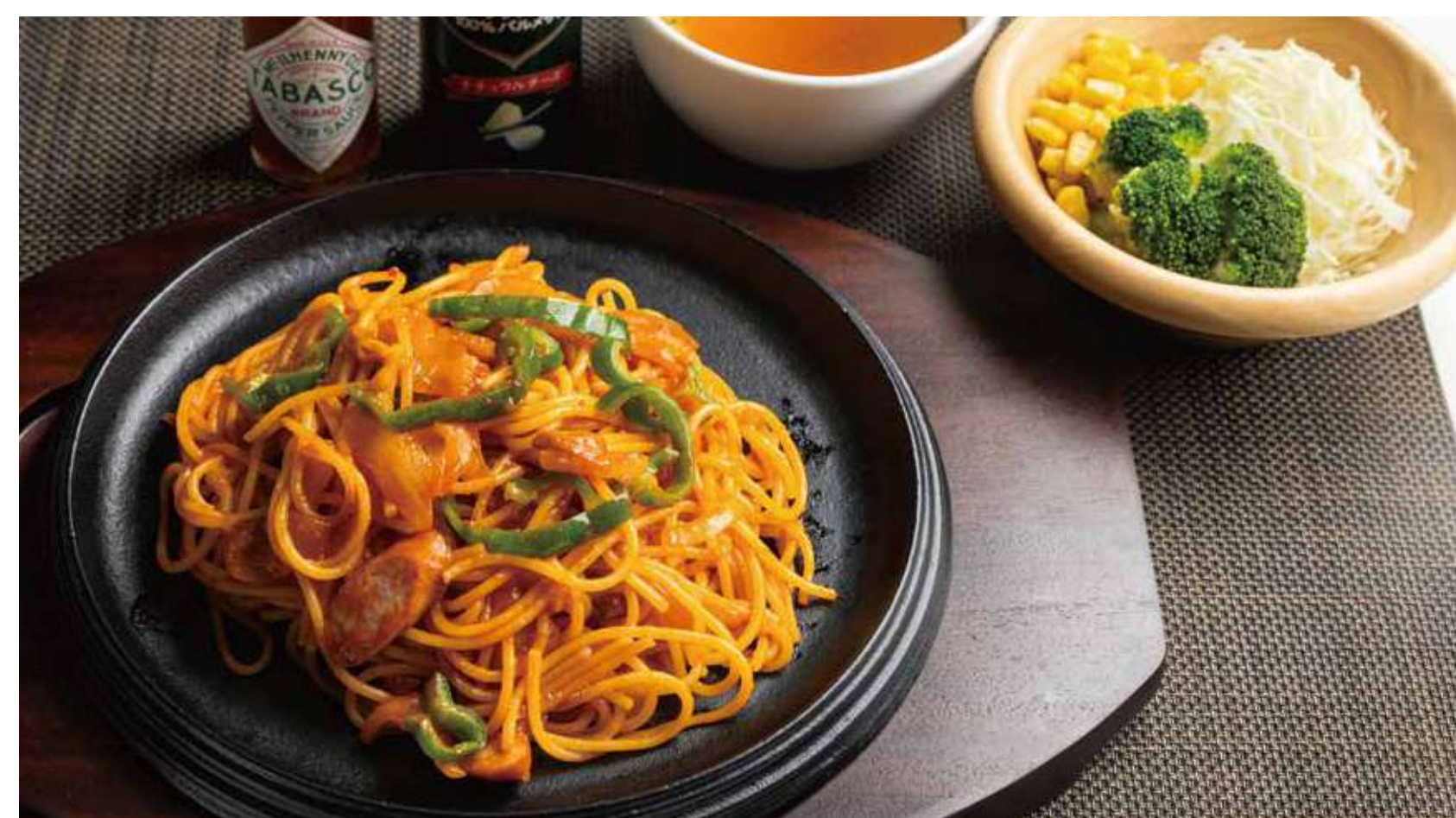
ナポリタンセット 1,300円 (カロリー1016kcal/塩分7g)