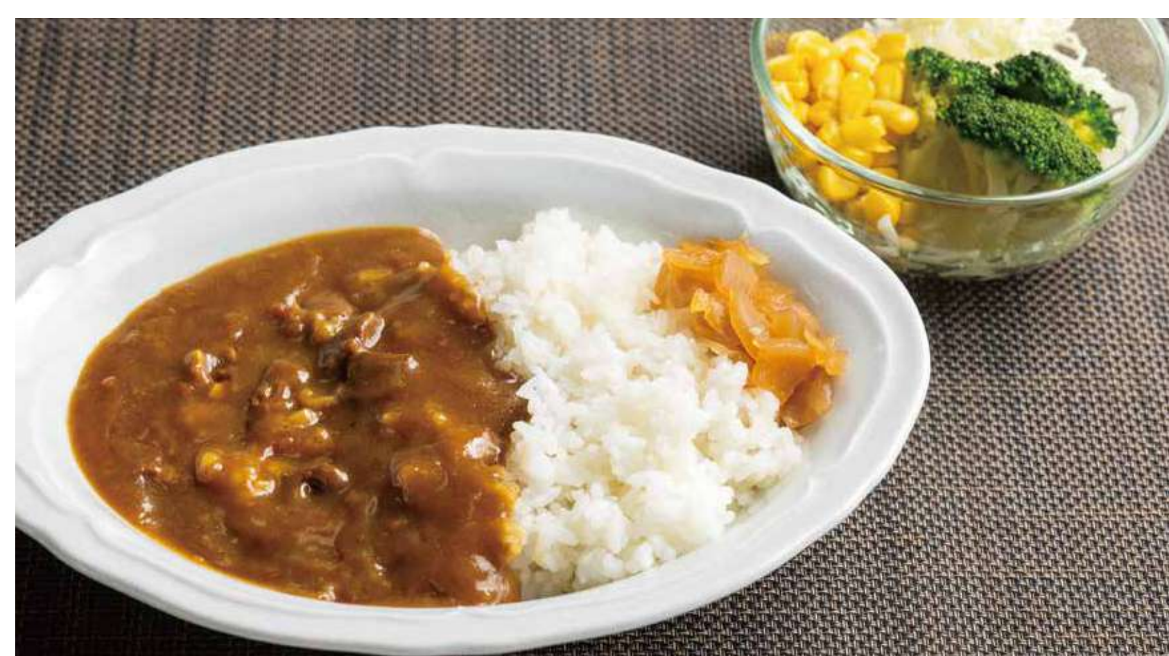
カレーライス 1,000円 (カロリー796kcal/塩分8.7g)