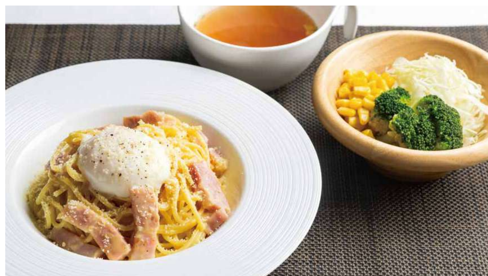
カルボナーラセット 1,300円 (カロリー1102kcal/塩分6.8g)