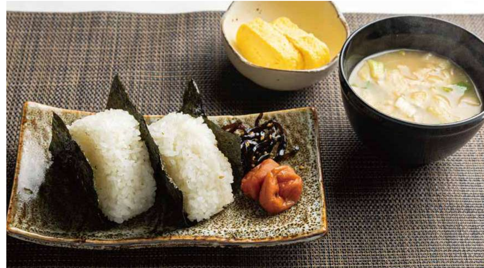
おにぎりランチ 600円 (カロリー369kcal/塩分4.6g)