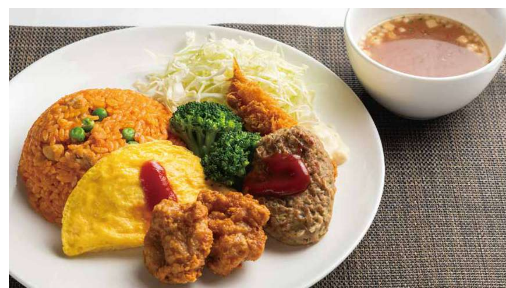
ポリウムバランスランチ 1,500円 (カロリー991kcal/塩分8g)