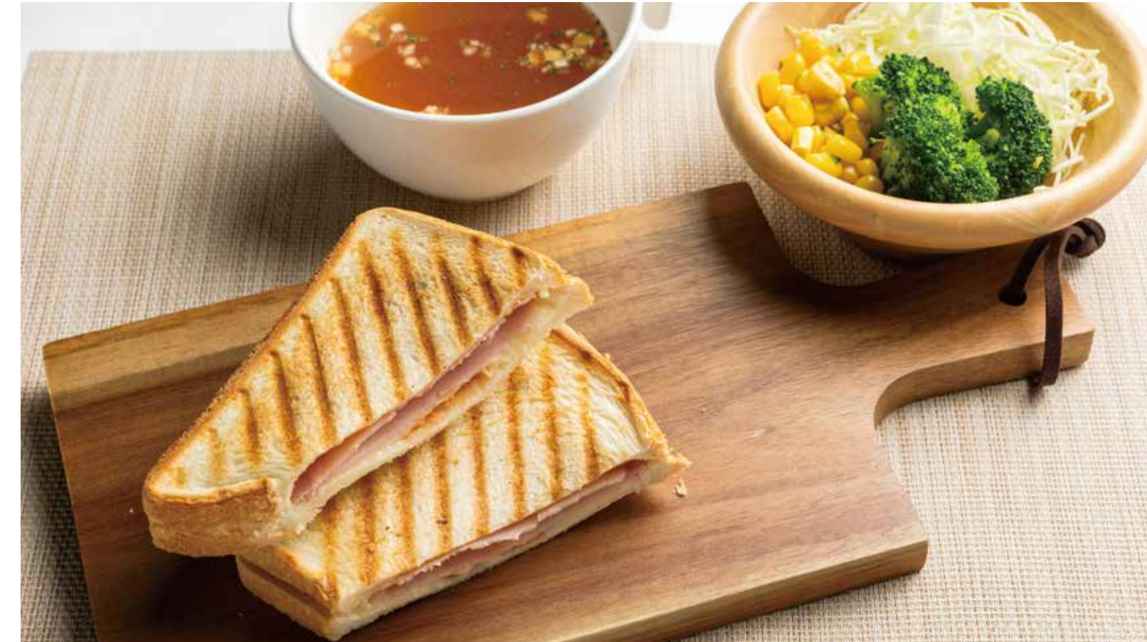
ホットサンドセット 800円 (カロリー492kcal/塩分4.3g)