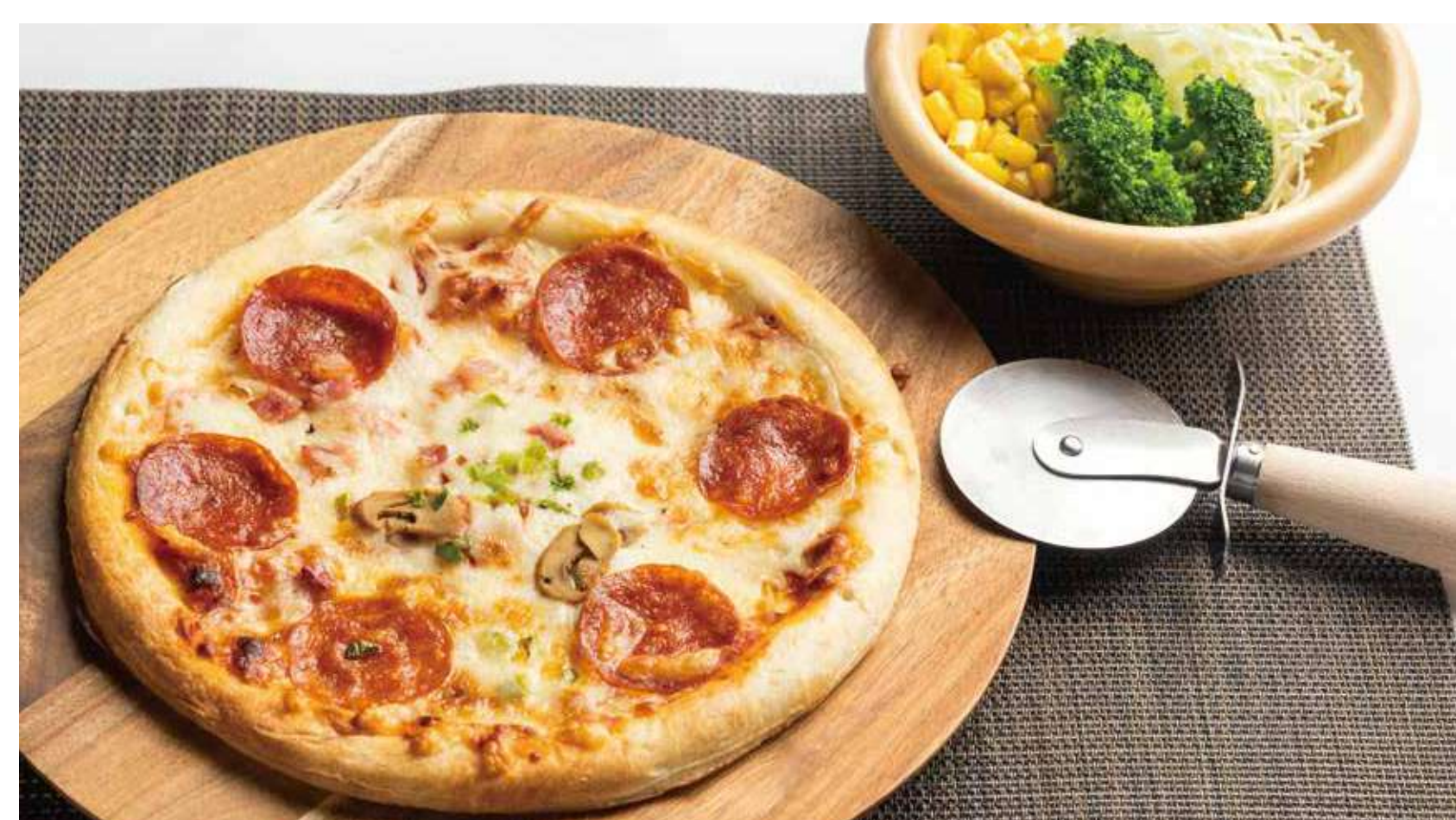
ピザセット 1,100円 (カロリー637kcal/塩分3.8g)