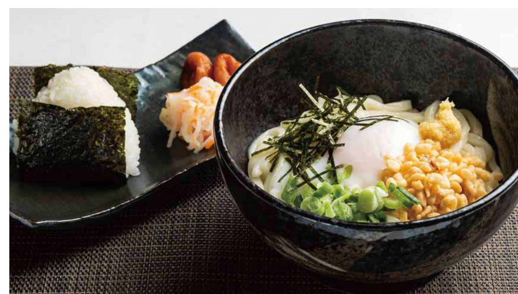
ぶっかけランチ 1,000円 (カロリー645kcal/塩分9.7g)