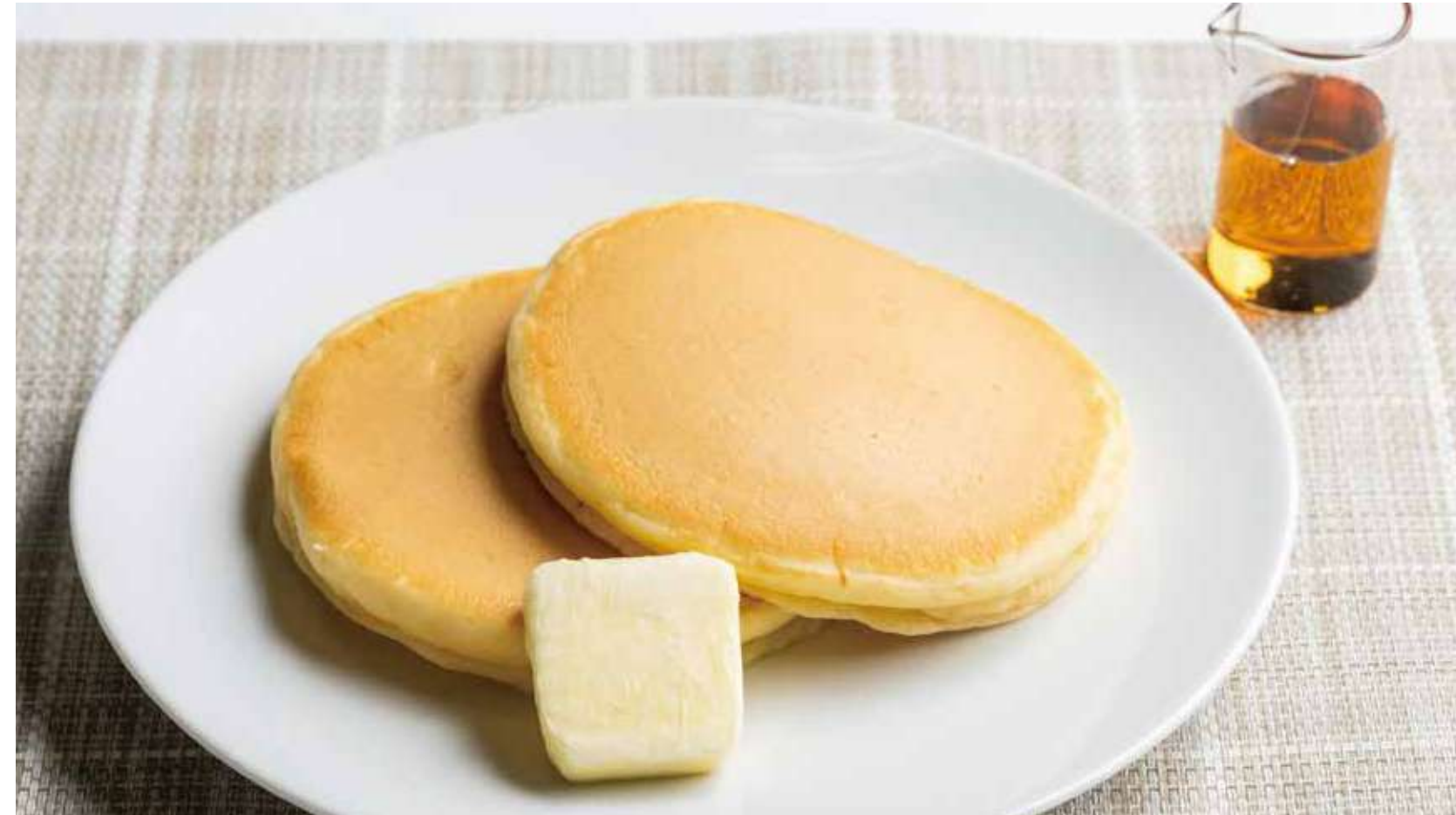
ホットケーキセット 600円 (カロリー383kcal/塩分0.9g)