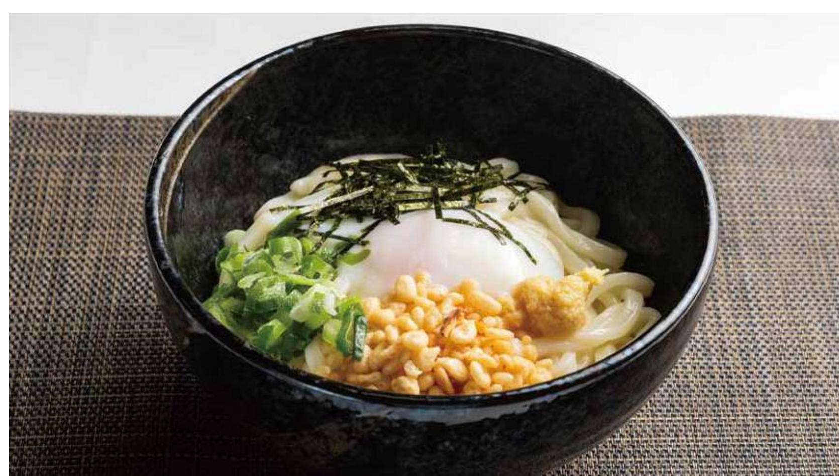
ぶっかけうどん 700円 (カロリー516kcal/塩分7.5g)