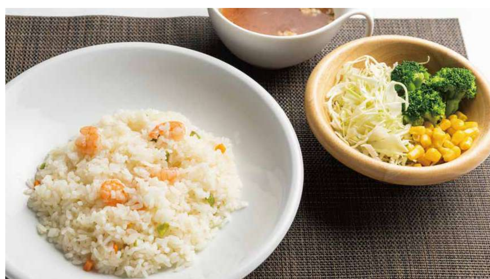
ピラフセット 1,000円 (カロリー561kcal/塩分5.2g)