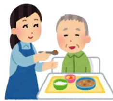
食事介助方法の指導