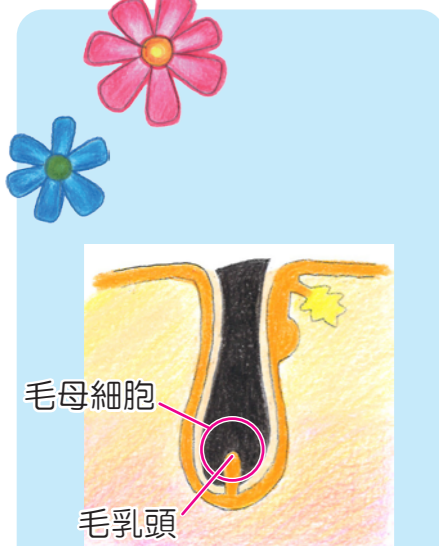
毛を剃った状態でレーザー照射します