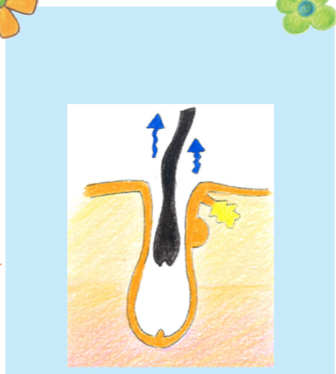
毛を育てる働きの毛母細胞が破壊され、残った毛は抜け落ちます