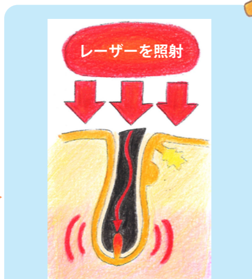
毛の黒色に吸収され、熱を持ち周囲に熱を広げます